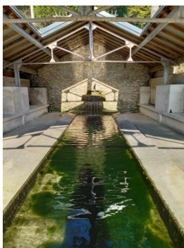
Lavoir de Pierrefonds - rue du bois d'Aucourt

Inscription obligatoire auprès de l'Office de Tourisme, seul(e) ou en équipe.