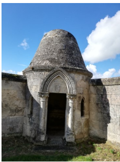
Eglise de Croutoy

L'Office de Tourisme Pierrefonds, Lisières de l'Oise organise pour la 1ère année une chasse aux trésors de son territoire.