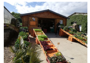
Serre de Courtieux