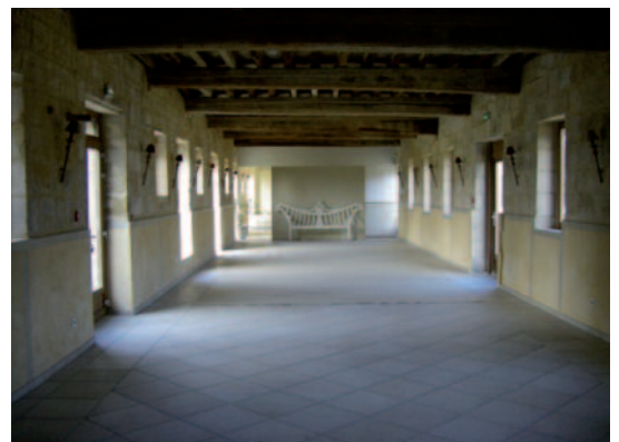
SALLE DE YOGA AU CHÂTEAU DE TRACY-LE-VAL

ou par courriel : nadiagarcia60@sfr.fr ou lesleodetracy@gmail.com