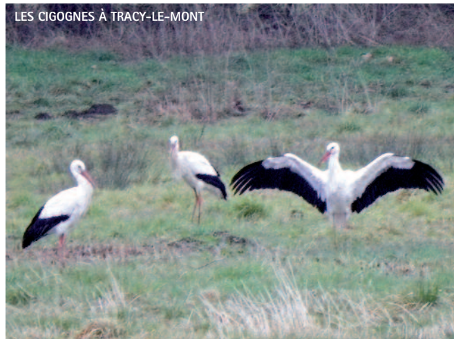
LES CIGOGNES À TRACY-LE-MONT

Protéger le vivant c'est aussi, par exemple, réduire sa production de déchets. En effet, si nous avons enfin pu obtenir de la communauté de communes d'Attichy qu'elle envoie nos ordures au SMVO plutôt que dans les décharges de l'entreprise Gurdebeke, encore faut-il se souvenir que cette collectivité procède principalement par incinération, méthode dont l'impact sur l'environnement est loin d'être neutre. Toutefois, le tri préalable y est-il mieux fait et