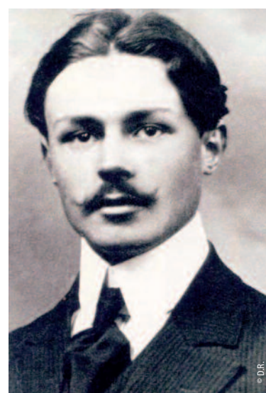
MAURICE GENEVOIX NÉ LE 29.11.1890 À DÉCIZE (NIÈVRE)

« Le 106 ème régiment d'infanterie, la 51 ème compagnie ».