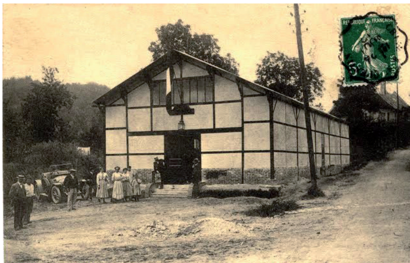
SALLE JULES FERRY CONSTRUITE PAR L'ASSOCIATION « AMICALE DES JEUNES GENS » ET INAUGURÉE LE 4 AOÛT 1912

La Grande Guerre épargne relativement le bâtiment qui retrouve ses fonctions de loisirs entre les deux guerres, des spectacles et des séances de cinéma y sont organisés. La seconde guerre mondiale mettra à nouveau un terme aux festivités, mais l'heure de gloire de la salle Jules FERRY se situe à la libération en septembre 1944 pour accueillir les américains vainqueurs.