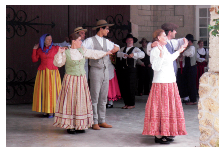
DANSE FOLKLORIQUE DES AÇORES AU CENTRE CARDIOLOGIQUE LÉOPOLD BELLAN