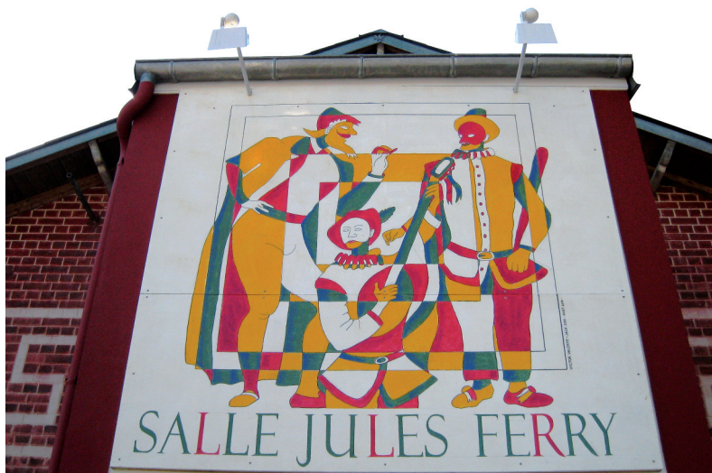
LA SALLE JULES FERRY DE NOS JOURS