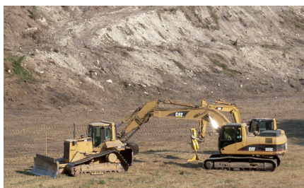
UN SITE DÉFIGURÉ...

La demande de référé-suspension que nous formulons aujourd'hui, en procédure d'urgence, a pour objectif de faire arrêter les travaux, en attente de la décision au fond, qui n'interviendra que dans plusieurs mois, et nous avons de fortes chances de réussite !