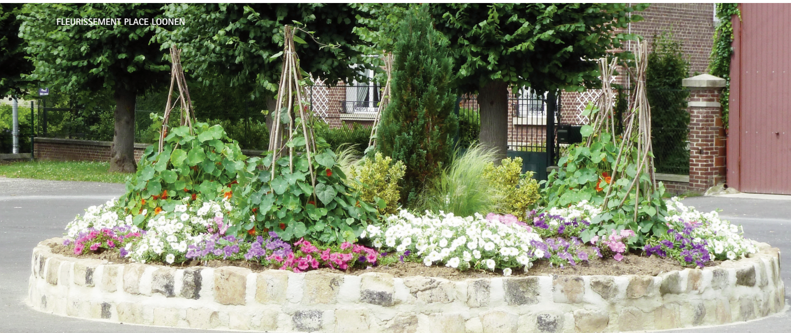
FLEURISSEMENT PLACE LOONEN

Impression certifiée par www.papiervert.fr