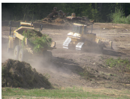
LES PELLEUSEUSES EN ACTION...

Et bien, plus large qu'on ne pourrait penser de prime abord. En effet le dossier que nous avons déposé, en février dernier, tout comme celui que nous avons élaboré ces derniers jours, sont les premiers qui vont amener les tribunaux à se prononcer sur nos arguments : mise en danger de la nappe phréatique et atteinte à la biodiversité, pour l'essentiel.