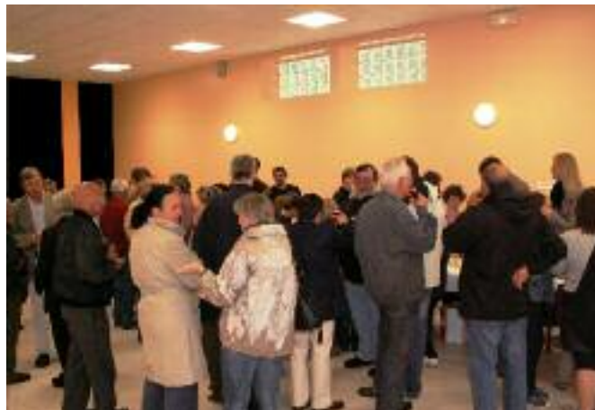
... RÉNOVÉE ET RÉHABILITÉE