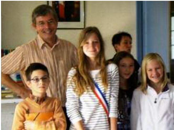
LA MAIRE JUNIOR ET SES ADJOINTS, ACCOMPAGNÉ DE M. LE MAIRE SENIOR