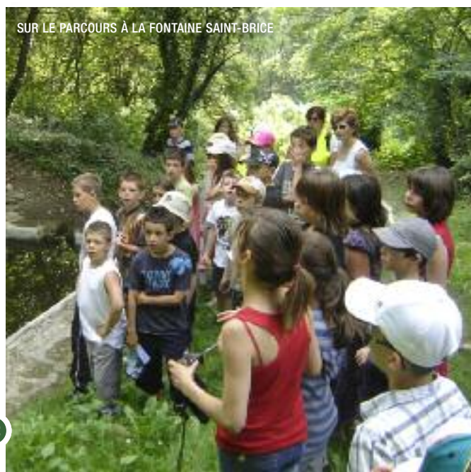
SUR LE PARCOURS À LA FONTAINE SAINT-BRICE