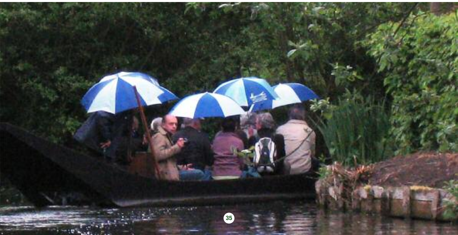
BALADE DANS LES HORTILLONS SUR L'EAU ET SOUS L'EAU