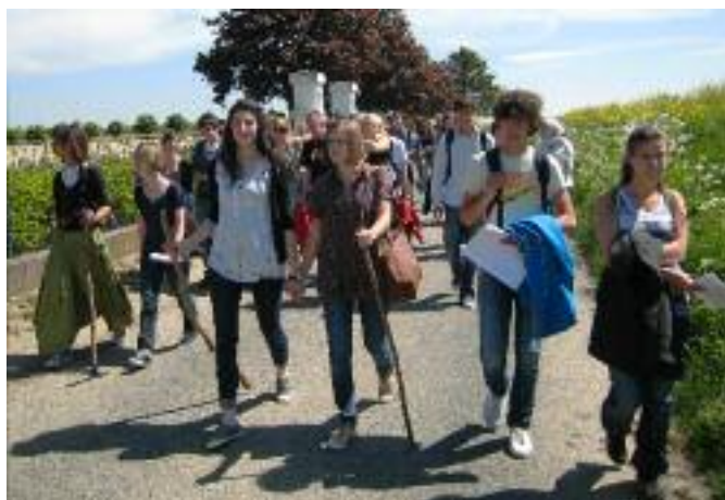
LES ÉLÈVES DE SAINT-NAZAIRE AU CIMETIÈRE MILITAIRE...