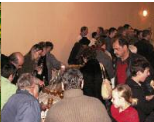
LES CANTINIÈRES AVAIENT PRÉPARÉ LA SOUPE POUR LA TROUPE