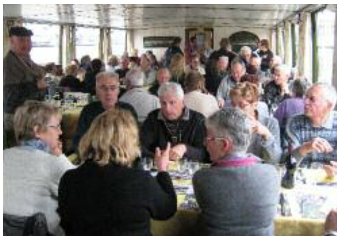
REPAS SUR L'EAU