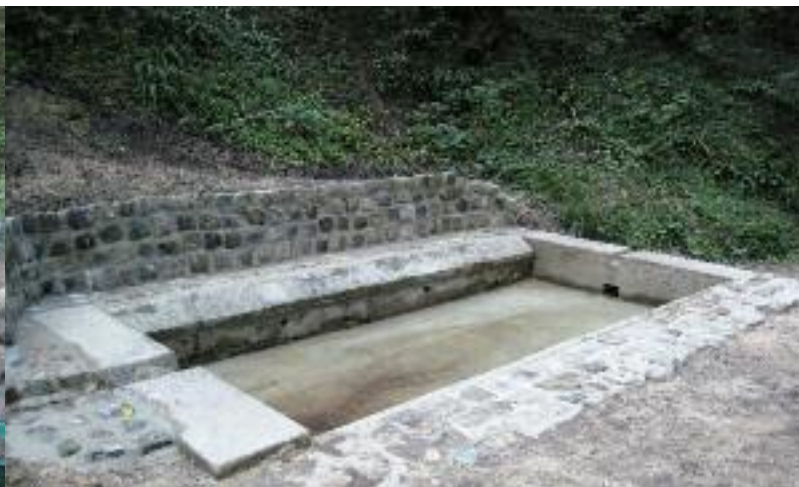
LES TRAVAUX ACHEVÉS