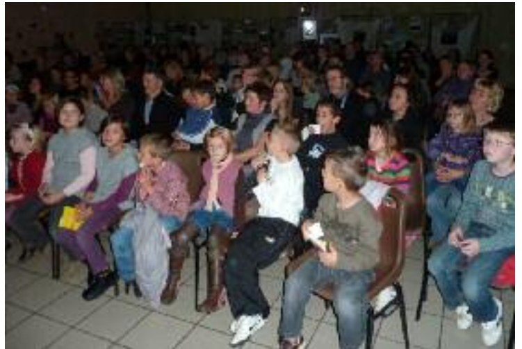
AMATEURS DE CONTES...