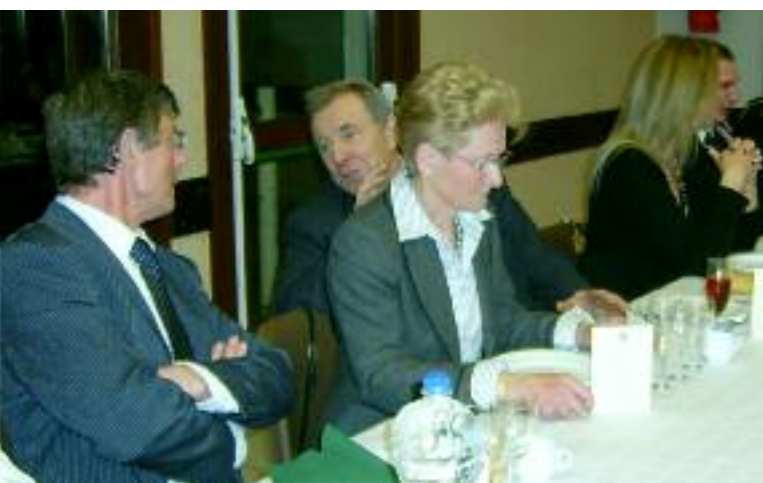
DISCUSSION ANIMÉE À LA TABLE DES POMPIERS

Sainte Barbe est patronne des pompiers mais aussi des artilleurs, des artificiers et des géologues.