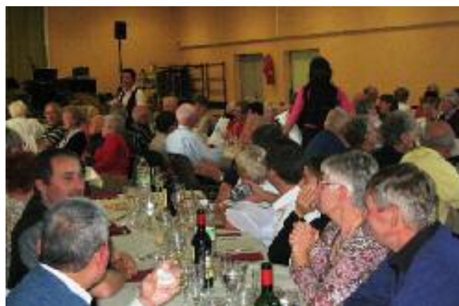
DES ANCIENS NOMBREUX À LA SALLE DES FÊTES