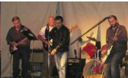
ÇA ROCK'N ROULE TOUJOURS...