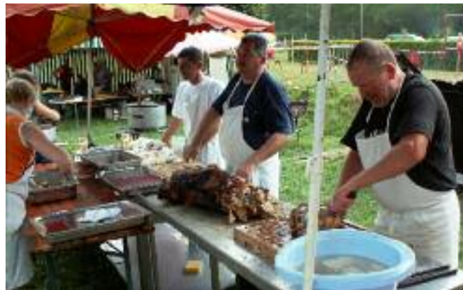
LES AS DU MÉCHOUI