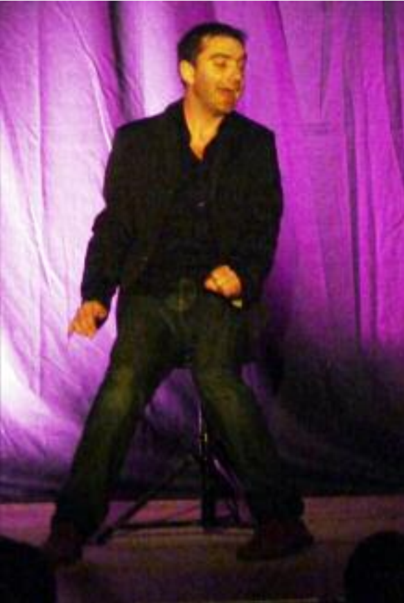
MÊME PAS PEUR, DE ET PAR JÉRÔME AUBINEAU ET BASILE GAHON

Cette manifestation connaît un succès grandissant puisque 250 personnes ont assisté aux différents spectacles donnés tout au long de l'après-midi et de la soirée. Merci au personnel de la tr@cythèque et à Traces et Cie pour leur implication dans la réussite de cette journée.