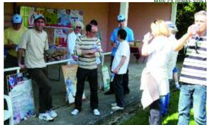
MAIS CA DONNE SOIF!