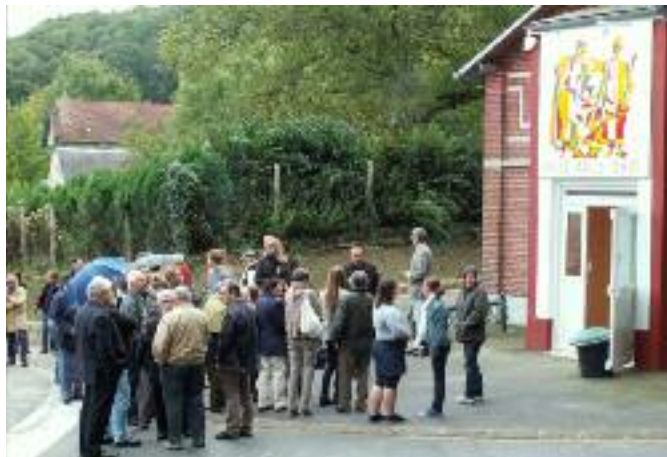
UNE SALLE POUR LES ASSOCIATIONS...

de sports, de spectacles, la salle Jules FERRY inaugurée une première fois en 1912 connaît ainsi une nouvelle jeunesse.