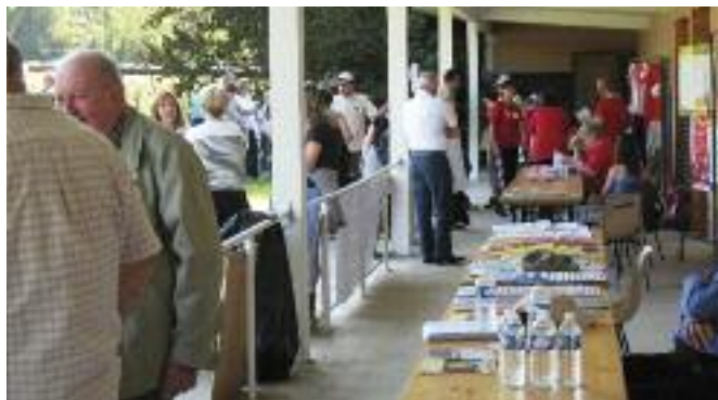
DU MONDE DANS LES STANDS