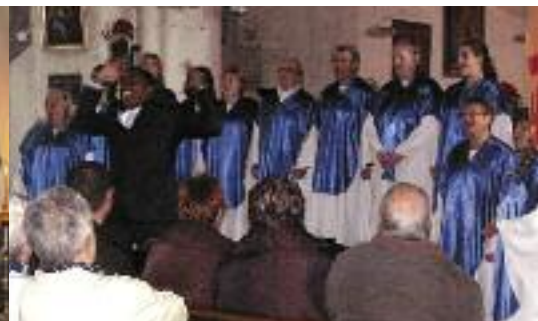
GOSPEL EN L'ÉGLISE ST BRICE DE TRACY-LE-MONT