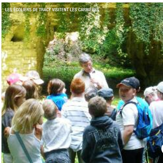
LES ÉCOLIERS DE TRACY VISITENT LES CARRIÈRES