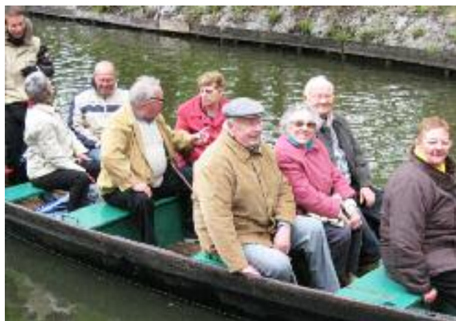
TOUT LE MONDE EMBARQUE...