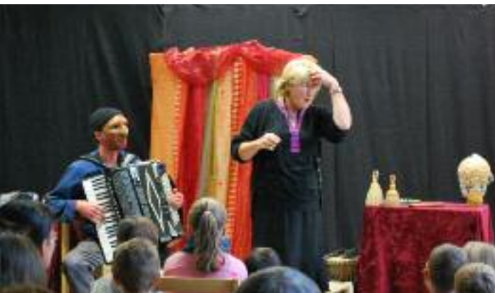
... ET CONTES D'AMATEURS ONT FAIT BON MÉNAGE