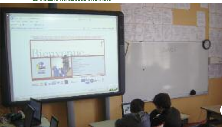
LE TABLEAU NUMÉRIQUE INTERACTIF

La fête de fin d'année Les Bulles De Tracy , sur le thème de la bande dessinée, a permis aux élèves de s'amuser aux différents stands préparés par les parents.