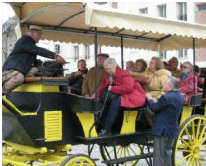
DÉCOUVRIR OU REDÉCOUVRIR AMIENS EN CALÈCHE

... Un rayon de soleil et quelques degrés en plus auraient quand même été bienvenus !