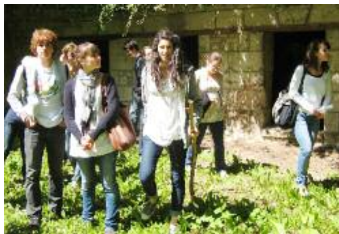
... ET DANS LES CARRIÈRES