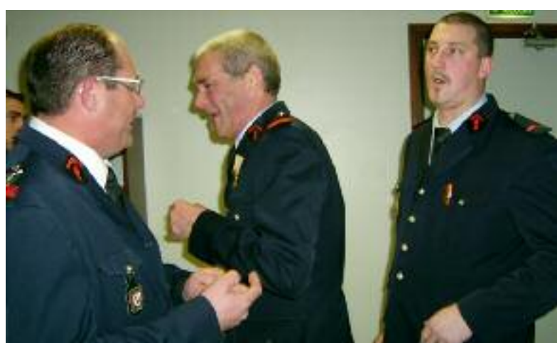
SAINTE BARBE DANS LA BONNE HUMEUR