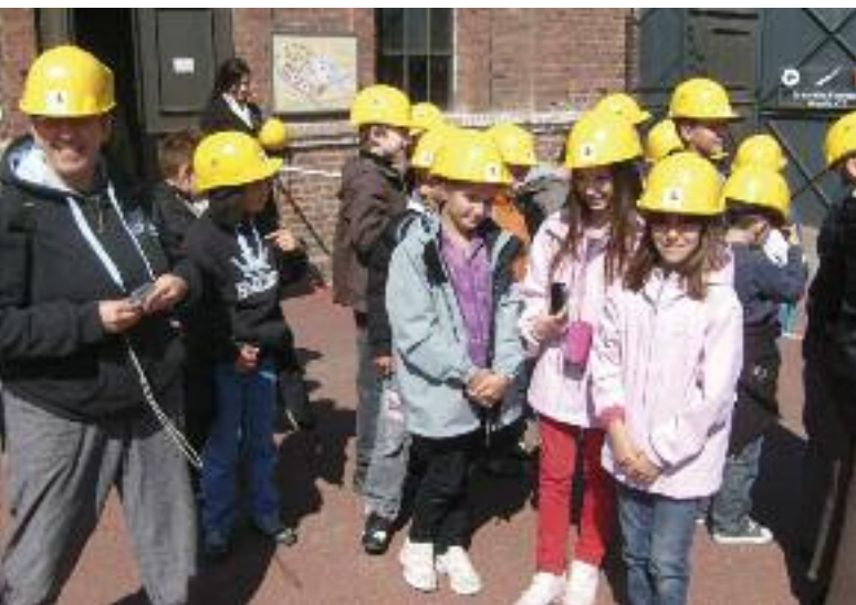
VOYAGE AU CENTRE MINIER LEWARDE

En décembre, les élèves du RPI se sont retrouvés salle Victor de l'Aigle pour le traditionnel spectacle de Noël, Ploum et Lili. Le challenge d'athlétisme de fin d'année s'est déroulé à Berneuil-sur-Aisne et a permis aux enfants de se mesurer à leurs camarades du canton d'Attichy.