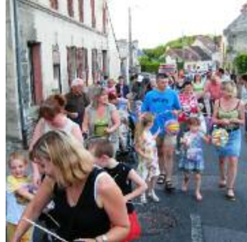
LA FÊTE AUX LAMPIONS