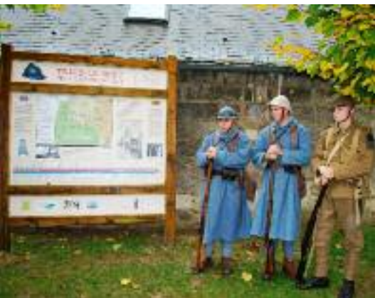
PANNEAU DE DÉPART

La mise en valeur du circuit dans les offices de tourisme de Pierrefonds, Compiègne et Noyon, nous laisse espérer de nombreux visiteurs l'an prochain.