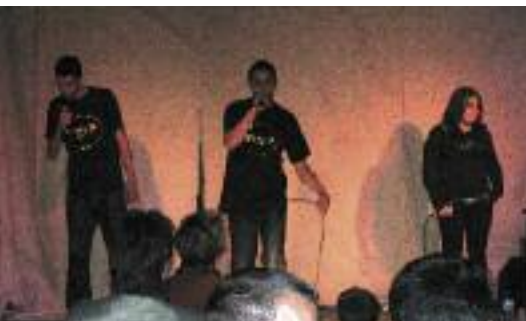
RAP... PEUR DE RIEN À LA SALLE JULES FERRY