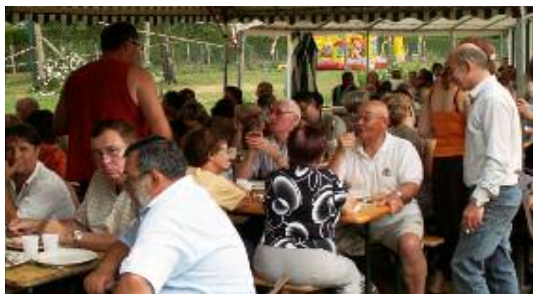
IL Y A DU MONDE AUX TABLES