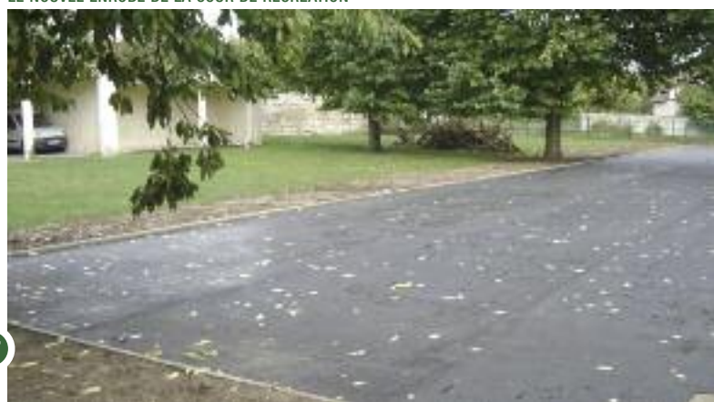
LE NOUVEL ENROBÉ DE LA COUR DE RÉCRÉATION

Pendant les grandes vacances, un enrobé a été réalisé dans la cour de récréation, qui permettra de pratiquer des activités sportives et de laisser les locaux en état de propreté.