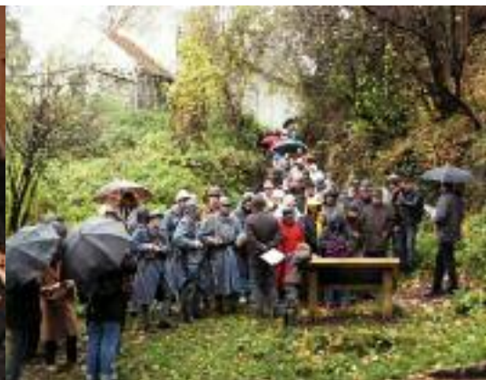
LA FOULE, MALGRÉ LE MAUVAIS TEMPS, LE JOUR DE L'INAUGURATION