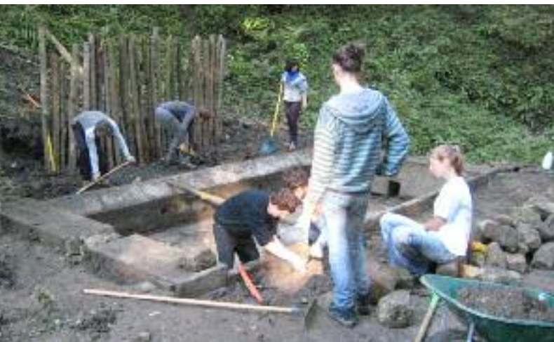
AUTOUR DU LAVOIR DU GODEBERT