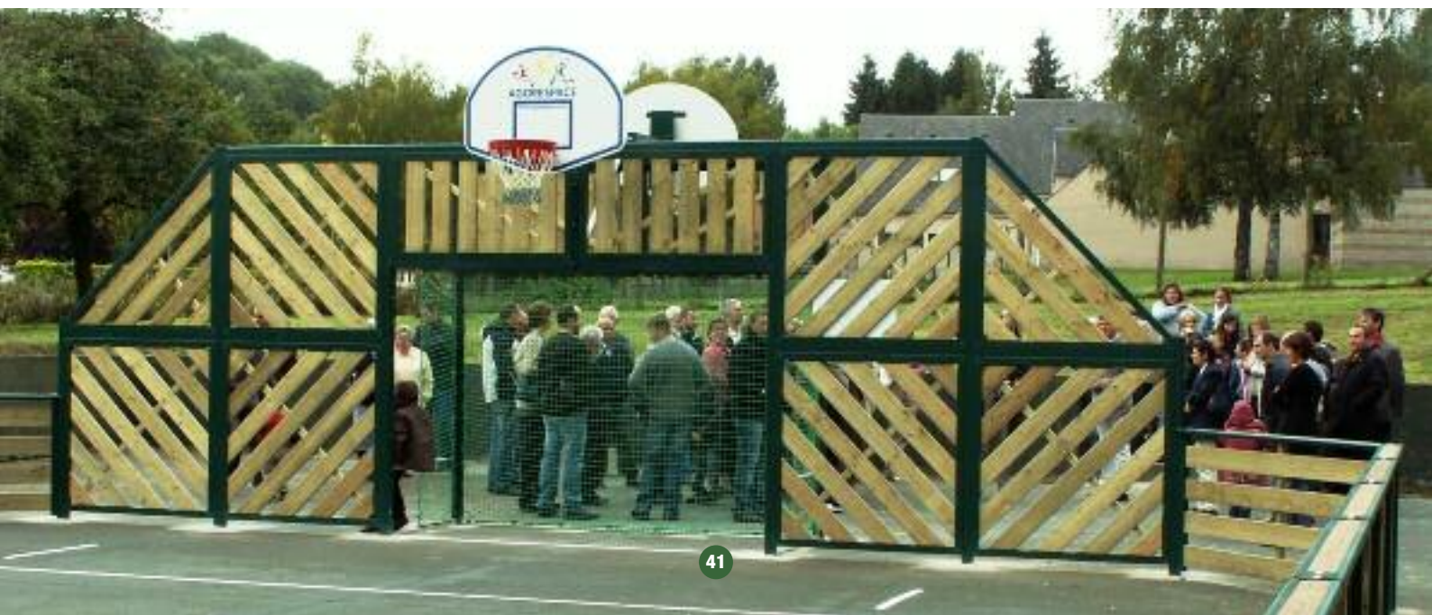
... PUIS PROFITER DU CITY-STADE