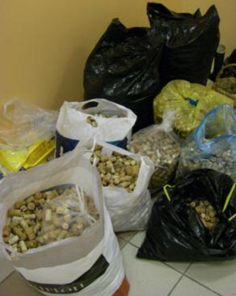
LA COLLECTE DES BOUCHONS EST UN VRAI SUCCÈS

PRESSE DE POMMES COMMUNALES LORS DE LA JOURNÉE DE L'ENVIRONNEMENT