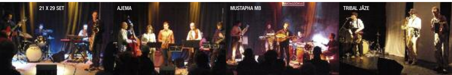
21 X 29 SET