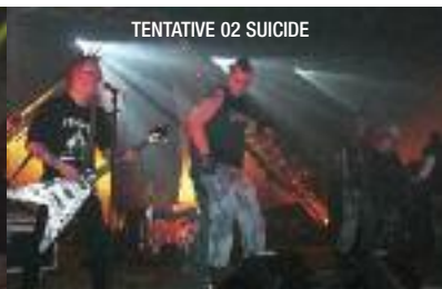
TENTATIVE 02 SUICIDE