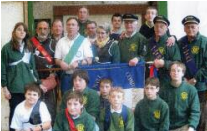
LE 5 AVRIL LORS DU TIR À L'OISEAU

Cette année encore, la Cie organise différentes manifestations (tir particulier au stade rue d'HANGEST suivi d'un concours spécial jeune, le dimanche matin 18 et 19 juin). Quelques soirées et repas sont programmées pour la saison 2010-2011 (Beaujolais, Choucroute, Italienne, Raclette, etc.), sans oublier notre traditionnel repas de la saint Sébastien , qui aura lieu le 23 janvier 2011 à midi.