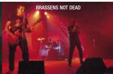
BRASSENS NOT DEAD