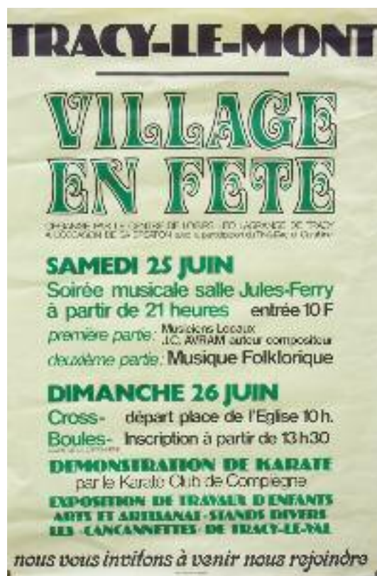
1ERE AFFICHE-PROGRAMME DE 1977