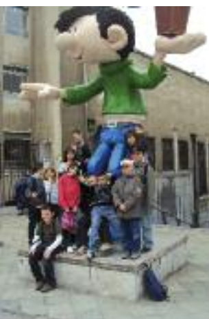
VISITE DE BRUXELLES

Les enfants ont pu également profiter de différentes sorties tout au long de l'année scolaire :