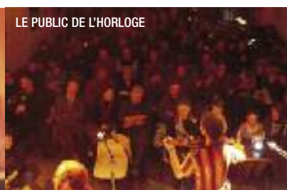
LE PUBLIC DE L'HORLOGE