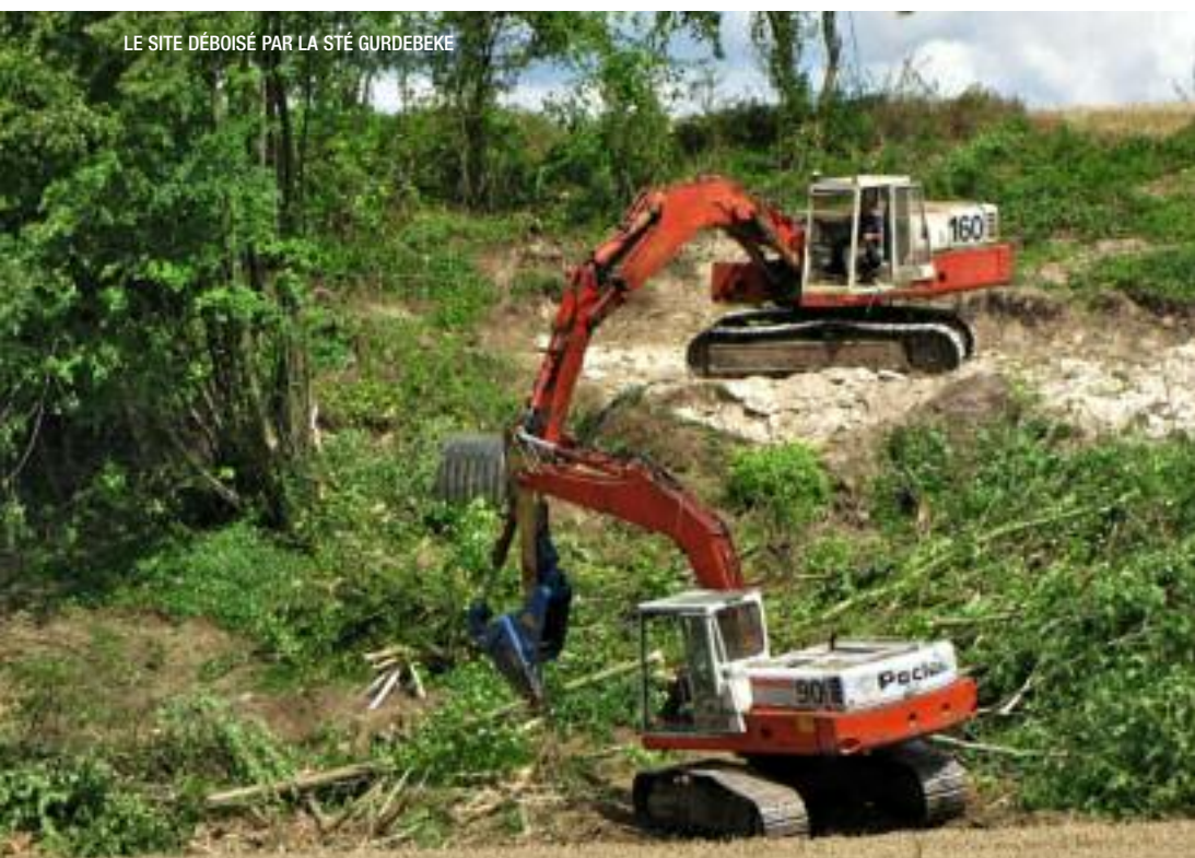
LE SITE DÉBOISÉ PAR LA STÉ GURDEBEKE

Recycler, paraît simple et logique mais ne l'est pas toujours. En