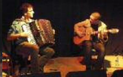
FÉLINS POUR L'AUTRE