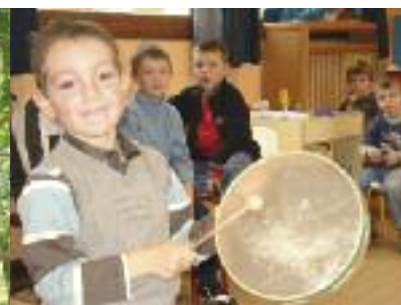
INITIATION À LA MUSIQUE