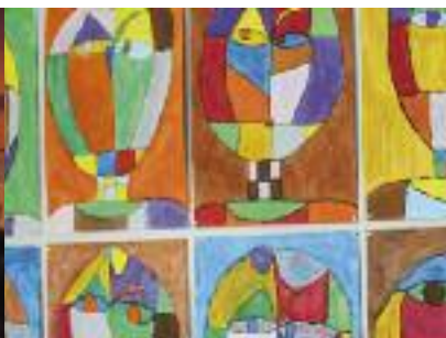
TRAVAIL D'ENFANTS DES ATELIERS ARTS PLASTIQUES