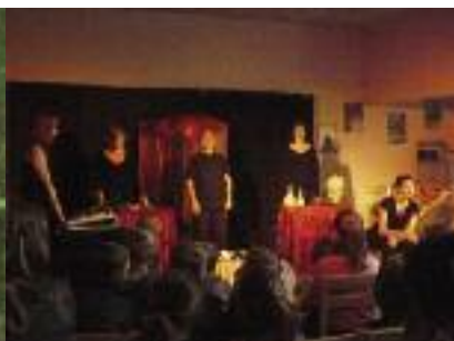
CROC-ÉPIC LE MANGEUR DE RÊVES, DE MICKAEL ENDE