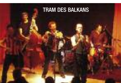
TRAM DES BALKANS