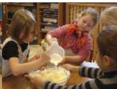
INITIATION À LA PÂTISSERIE