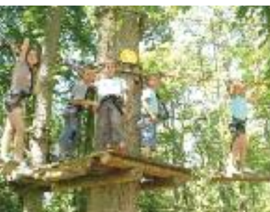
GRIMP A L'ARB