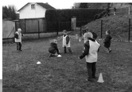
CAMP DE CAYEUX ÉTÉ 2009.

DÉCOUVERTE DU RUGBY, LES ALL BLACKS PEUVENT TREMBLER.