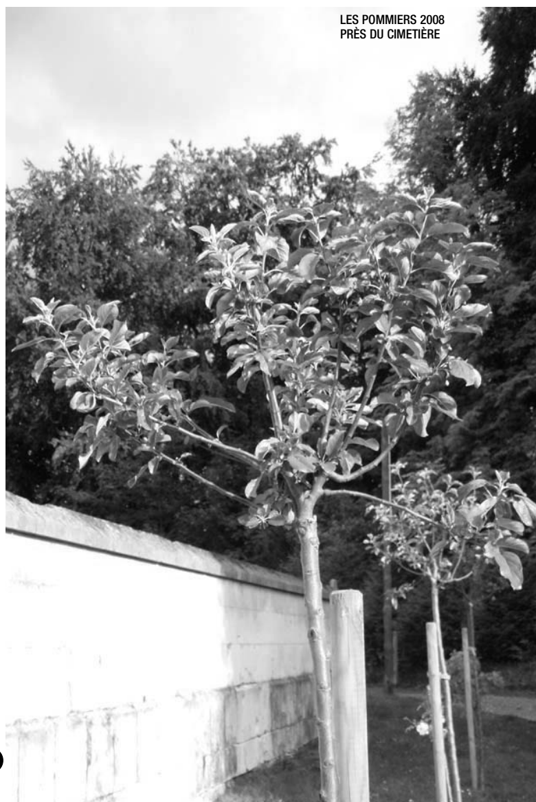
LES POMMIERS 2008 PRÈS DU CIMETIÈRE