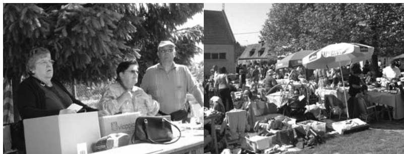
NOTRE STAND LORS DE LA BROCANTE DE PRINTEMPS OÙ IL Y AVAIT FOULE