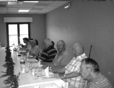
LORS DU 1 er REPAS