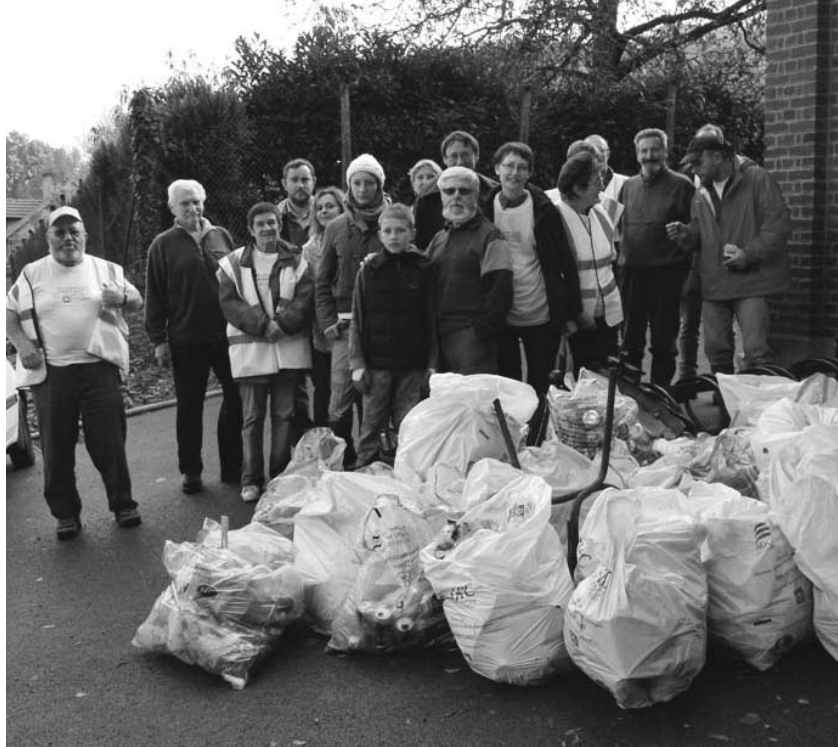
LE RÉSULTAT DE LA COLLECTE D'ORDURES LAISSÉES AU BORD DES CHEMINS ET DES PARTICIPANTS À LA TROISIÈME JOURN'ÉCOLO

Une belle promesse de récoltes pour les années à venir.