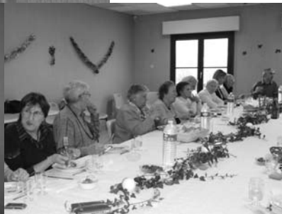
AMBIANCE DE FÊTE AU 2 e REPAS GRÂCE AU PERSONNEL DE LA BIBLIOTHÈQUE