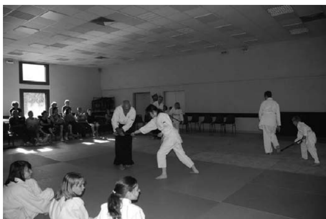
SOIRÉE ARTS MARTIAUX – AÏKIDO