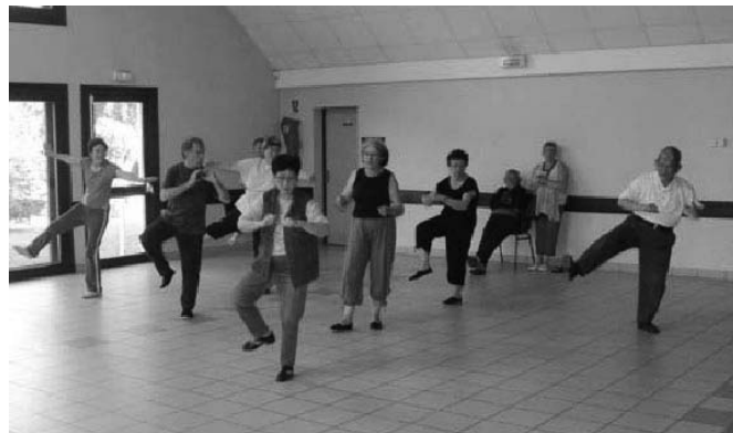
COURS DE TAÏ CHI SALLE VICTOR DE L'AIGLE

Après cette année bien remplie, nous avons terminé la saison avec notre buffet annuel au Golf de la Folie, rencontre très conviviale de l'ensemble de nos adhérents.