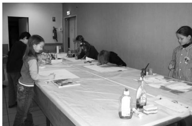
LES ÉLÈVES DES ATELIERS ARTS PLASTIQUES EN PLEIN TRAVAIL

Nous remercions la municipalité de Tracy-le-Mont sans qui ces ateliers ne pourraient fonctionner.