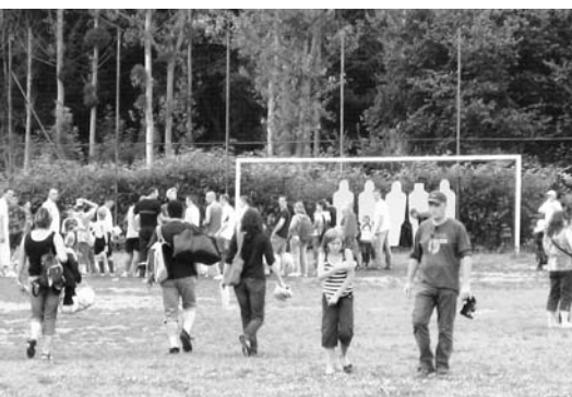
LES ANIMATEURS DES TOURNOIS