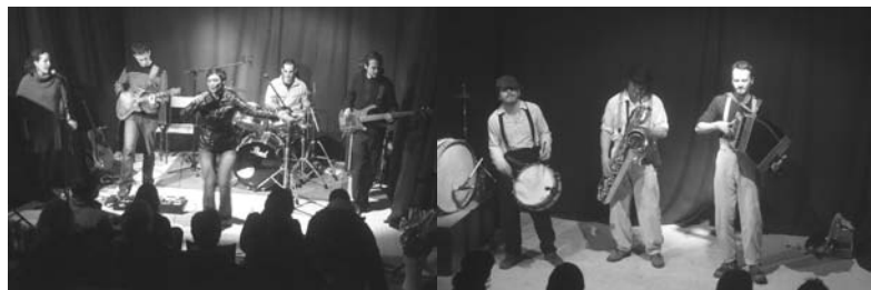
COURIR LES RUES