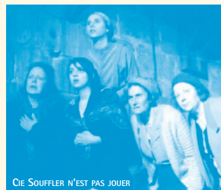
CIE SOUFFLER N'EST PAS JOUER