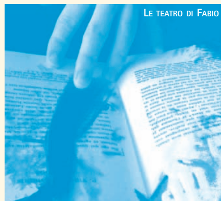
LE TEATRO DI FABIO

De la dureté inévitable qui marque le début, où les deux femmes, presque comme deux étrangères rivales, s'étudient avec précaution, sans céder de terrain à l'autre, on passe à un rapprochement lent et espéré. La relation mère-fille prend peu à peu le dessus ; les personnages tentent de régler leurs comptes avec le passé, de se confronter sur leurs sentiments, sur leurs choix, sur leurs raisons, sur les comment et les pourquoi ils se sont perdus.