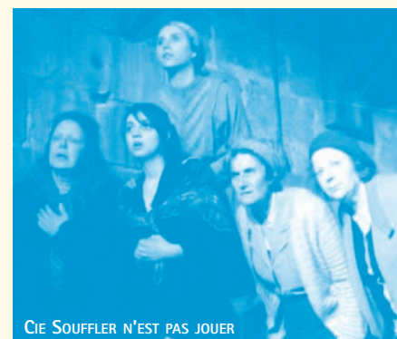
CIE SOUFFLER N'EST PAS JOUER

UNE MÈRE ET SA FILLE. Deux fortes personnalités que leur vie et les choix qu'elles ont faits séparent depuis onze ans : la mère, écrivain à succès de romans systématiquement en tête des meilleures ventes ; la fille ex-terroriste, détenue dans une prison de