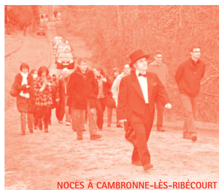
NOCES À CAMBRONNE-LÈS-RIBÉCOURT

Autre nouveauté, les enfants de l'atelier Théâtre participeront aux 3 èmes Rencontres Jeunes Théâtre, CÔTÉ COUR mais aussi, à l'OISE AU THÉÂTRE, organisé par le Conseil général de l'Oise dans le somptueux cadre du Parc Jean-Jacques ROUSSEAU d'Ermenonville.