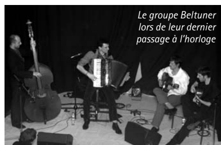
Le groupe Beltuner lors de leur dernier passage à l'horloge

Le vendredi 10 octobre , vous pourrez revoir et ré-entendre le groupe BELTUNER . Ils viendront nous présenter leur second album à l' Horloge . À n'en pas douter, encore une soirée de folie.