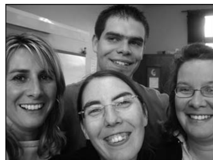
La nouvelle équipe d'animation, de gauche à droite

Ci-contre, la nouvelle équipe d'animation composée de professionnels compétents et diplômés accueille les enfants dès le 2 septembre 2008.